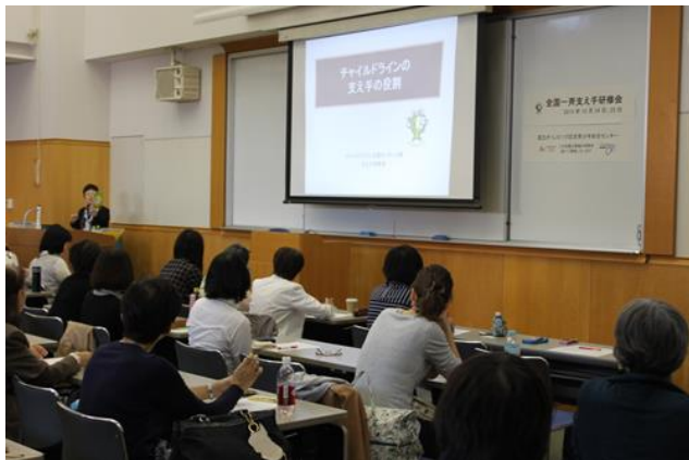
〔チャイルドラインの支え手の役割のレクチャー〕

( http://www.voluntary.jp/weblog/myblog/1252/3983829#3983829 )